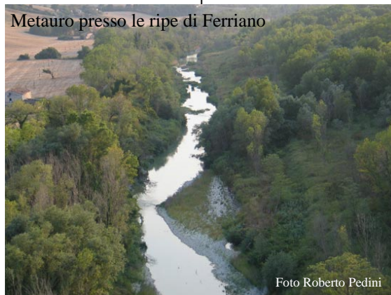
Metauro presso le ripe di Ferriano

Si spera che a tutti questi soggetti si uniscano ora anche i comitati che, facendo un ottimo lavoro di contrasto delle varie emergenze, potrebbero incanalare le loro energie in una prospettiva più ampia.